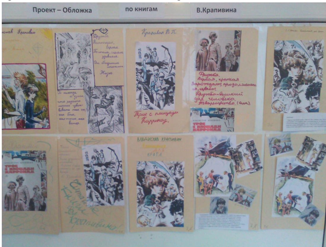
Проект – Обложка 7 класс